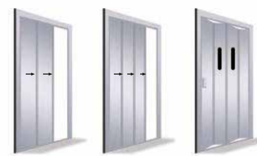
Automatique à 2 vantaux