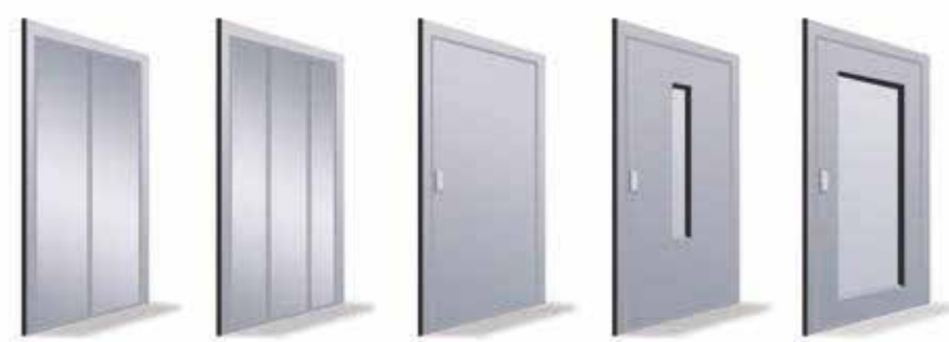
Automatique à 2 vantaux