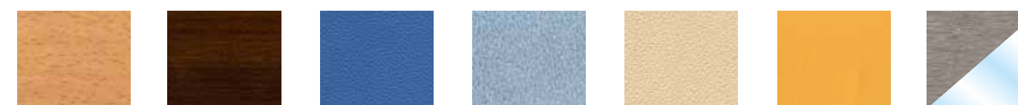
Skinplate Bois Clair